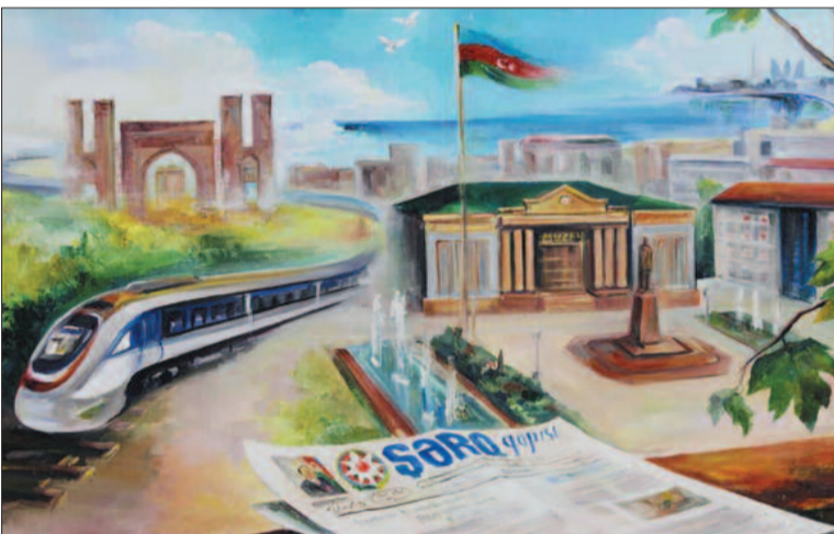
Həbibə Allahverdiyeva ("Muxtariyyət yollarında")